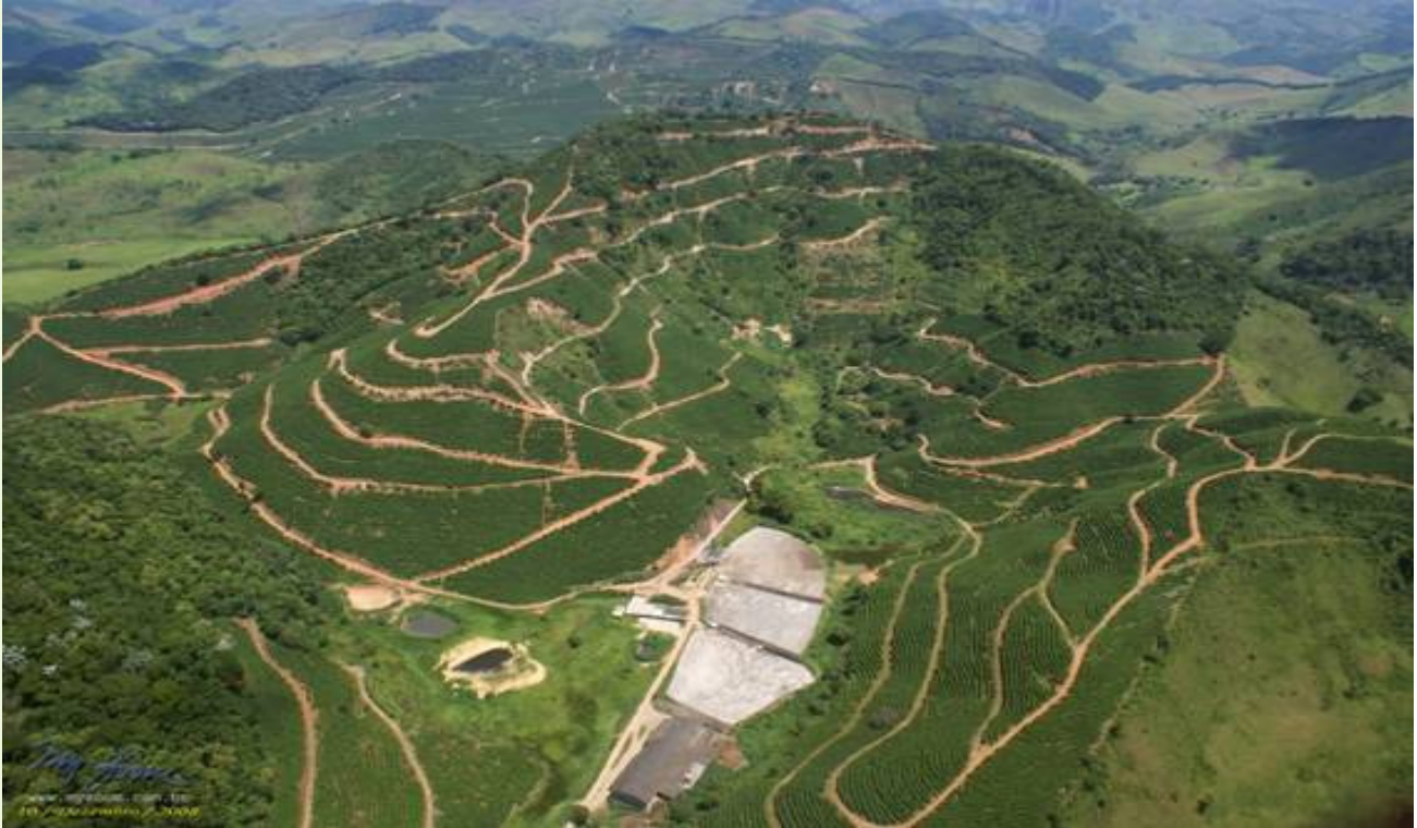
Mosaico entre pastagens e remanescentes florestais na região pré-montanhosa da Serra do Mar, entre Rio Bonito e Silva Jardim.

Os ruralistas querem retirar desse grupo o topo de morros, terras de encostas com mais de 45° e áreas em altitude superior a 1.800 metros - hoje considerados de preservação permanente.