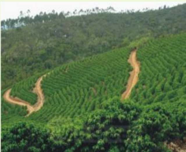
Plantações de café nas encostas dos morros